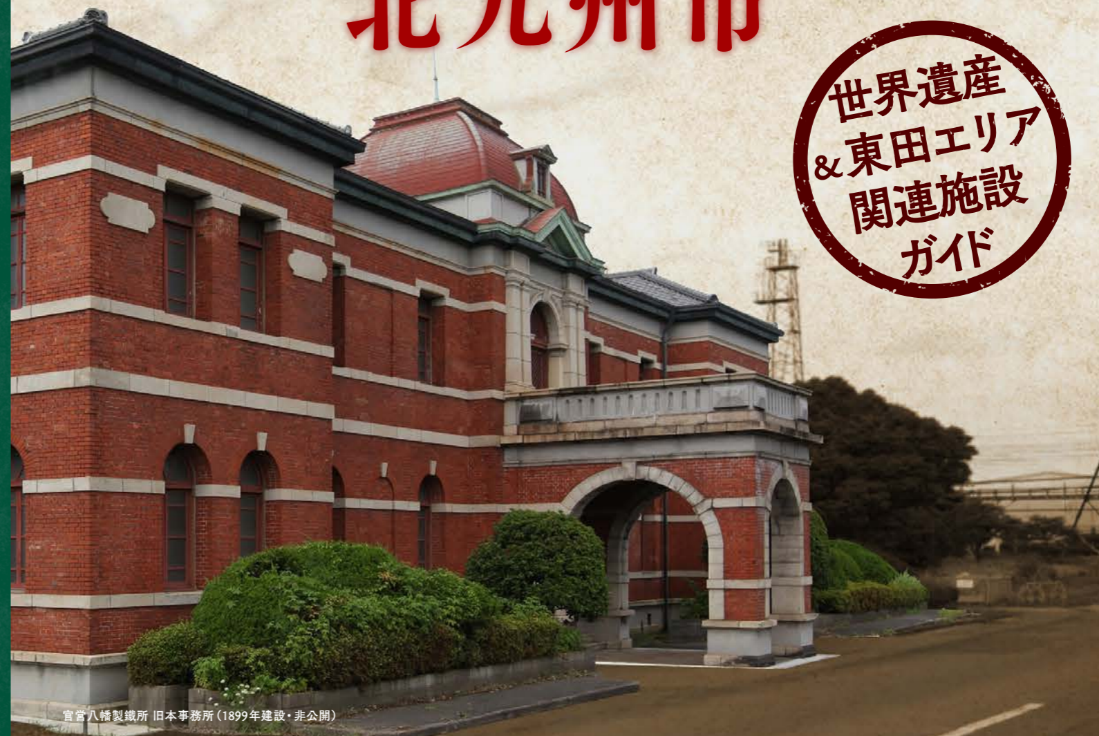
官営八幡製鐵所 旧本事務所 (1899年建設・非公開)